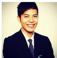
講師プロフィール

KDDIが本気でECモール「Wowma!」を運営するワケ Wowma!とは何か。 モールの概要と戦略についてお話しします。